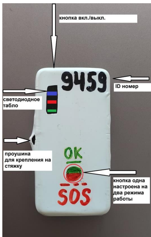
РИС.2 Схема-инструкция трекера

Прибор устанавливается экипажем под лобовое стекло или на каркас безопасности (при наличии) при помощи многоразовой застежки, стяжек или двусторонней клейкой ленты. При этом стяжки не должны перекрывать светодиодное табло и кнопку OK/SOS, чтобы исключить случайное нажатие при движении. Трекер в месте крепления не должен иметь закрытого металлического контура, который может давать помехи приёма сигнала GPS.